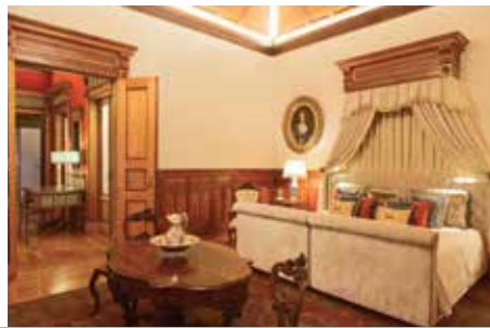
Quarto da suite D. Carlos

Desde 2011, tornou-se também – pela primeira vez na sua longa história – um espaço aberto ao público, oferecendo um programa cultural variado, como visitas guiadas ao palácio e capela, exposições temporárias e outras iniciativas.