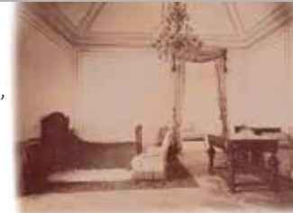
Quarto do rei D. Luís no Palácio da Cidadela de Cascais.