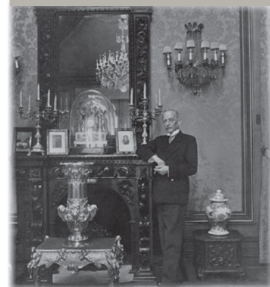
Óscar Carmona no salão do Palácio da Cidadela de Cascais. Cecil Beaton, c. 1949 Museu da Presidência da República

É com o Estado Novo que termina a obrigação de os presidentes pagarem uma