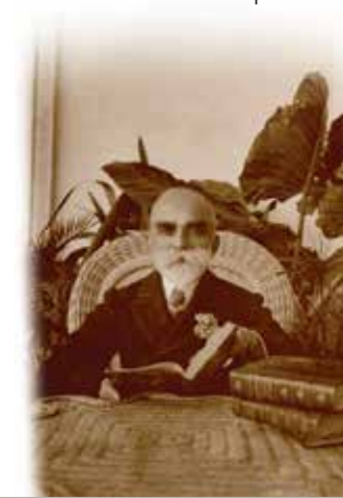
Bernardino Machado no Palácio da Cidadela de Cascais. 1917

Palácio da Cidadela os presidentes Bernardino Machado (1915-1917 / 1925-1926), Canto e Castro (1919), António José de Almeida (1919-1923) e Manuel Teixeira Gomes (1925).