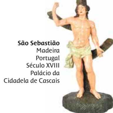
São Sebastião Madeira Portugal Século XVIII Palácio da Cidadela de Cascais