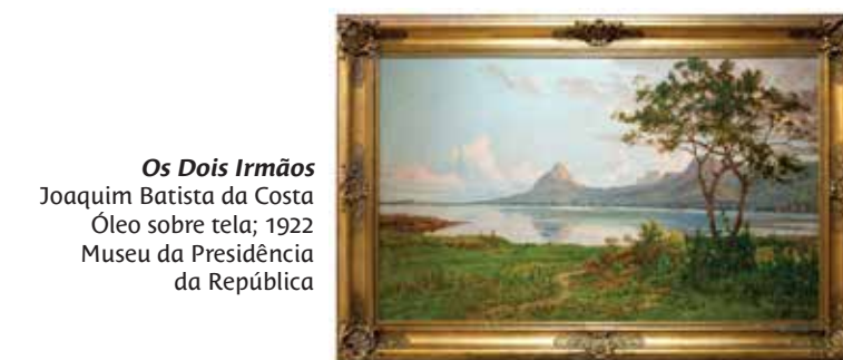
Os Dois Irmãos Joaquim Batista da Costa Óleo sobre tela; 1922 Museu da Presidência da República

iniciou-se o estudo da história e das vivências do palácio – um primeiro e importante passo no sentido da sua reabilitação. As obras seriam concretizadas entre 2007 e 2011, já na presidência de Aníbal Cavaco Silva, um processo conduzido pela Presidência da República, com verbas disponibilizadas pelo Turismo de Portugal. Em 2011, o Palácio da Cidadela de Cascais abriu ao público pela primeira vez na sua história.