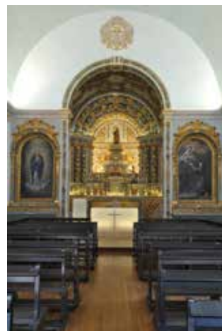
Altar-mor da capela da Nossa Senhora da Vitória

no essencial, o aspeto que hoje mantêm: a porta de armas, as muralhas e as baterias (lugar de onde se disparavam os canhões), os edifícios e a capela de Nossa Senhora da Vitória.