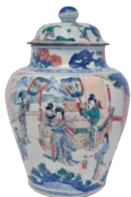
Pote com tampa Porcelana decorada a azul sob o vidrado e esmaltes sobre o vidrado, wucái ou «cinco cores» China Meados do século XVII Casa Reynaldo dos Santos / Câmara Municipal de Cascais

Óscar Carmona optou por residir no Palácio da Cidadela de Cascais, com a família, entre 1928 e 1945.