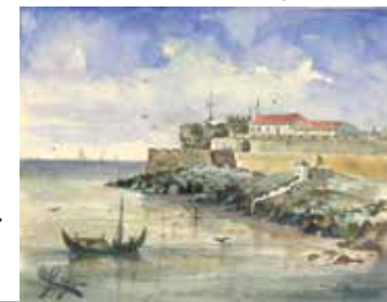
Aguarela do rei D. Carlos representando o Palácio da Cidadela de Cascais. 1885