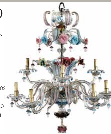
Lustre Vidro Itália (Murano) Século XIX Presidência da República