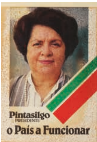
AUTOCOLANTE DA CANDIDATURA DE MARIA DE LOURDES PINTASILGO ÀS PRESIDENCIAIS DE 1986. STICKER FROM MARIA DE LOURDES PINTASILGO'S CANDIDACY TO THE 1986 PRESIDENTIAL ELECTIONS. 1985-1986