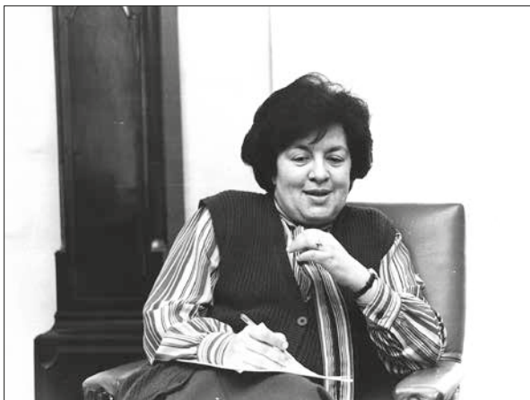
MARIA DE LOURDES PINTASILGO, MINISTRA DOS ASSUNTOS SOCIAIS. MARIA DE LOURDES PINTASILGO AS MINISTER FOR SOCIAL AFFAIRS. Ca. 1975